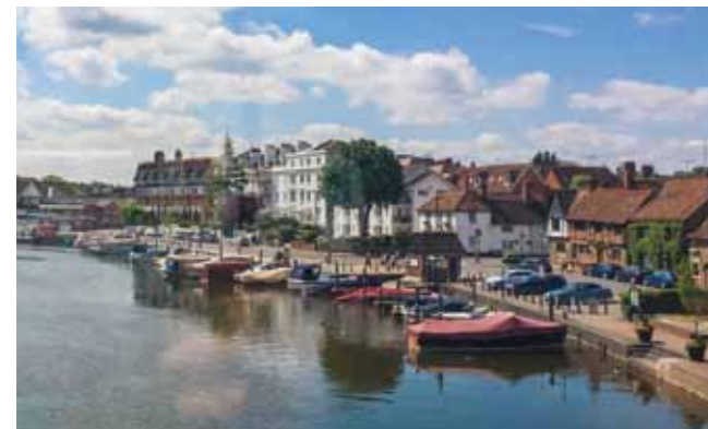
Oben: Rudern auf der Themse in Henley-on-Thames

Schwierig wird es in vielen Restaurants im stadtnahen Gebiet, in denen Hunde nicht erlaubt sind. Eine Nachfrage beim Servicepersonal ist empfehlenswert.