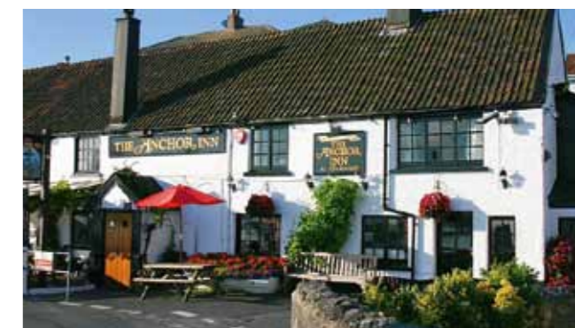
Das »Anchor Inn« liegt am Hafen und bietet besten Fisch

Das 15 min. Fußweg entfernte Restaurant »The Anchor Inn« an der Küste bietet lokale Spezialitäten und alles rund um den Fisch. Sehr lecker! Im über 450 Jahre alten Haus sitzt man im urigen Innenraum oder auf der kleinen Terrasse und schaut auf die Fischerboote, die hier bei Ebbe auf dem Trockenen liegen. www.anchorinncockwood.com