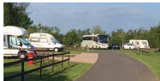
Die Sonne scheint! Ankunft auf dem Camping »Little Satmar«