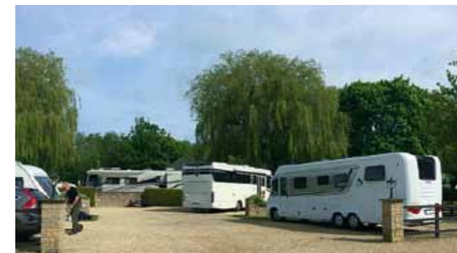
Unsere Basis bei Oxford: »Lincoln Farm Park Oxfordshire«

Auf dem Fluss ist auch das »Punting« sehr beliebt - hier kann man sich wie auf einem »Stoherkahn« an den Sehenswürdigkeiten vorbei rudern lassen.