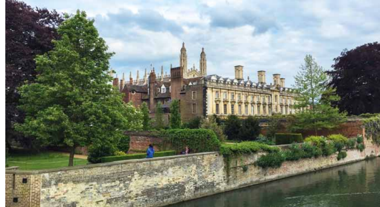
Blick auf Clare College der Universität Cambridge, die im Jahre 1209 gegründet wurde und als eine der angesehensten der Welt gilt

Alternativ kann man auch mit einem öffentlichen Bus fahren. Die Haltestelle liegt in der Nähe, das Ticket kostet 4 Pfund pro Person. Eine Parkmöglichkeit für das Auto (Grand Arcade car park) befindet sich nahe der Touristen-Info, von der auch geführte Touren möglich sind.