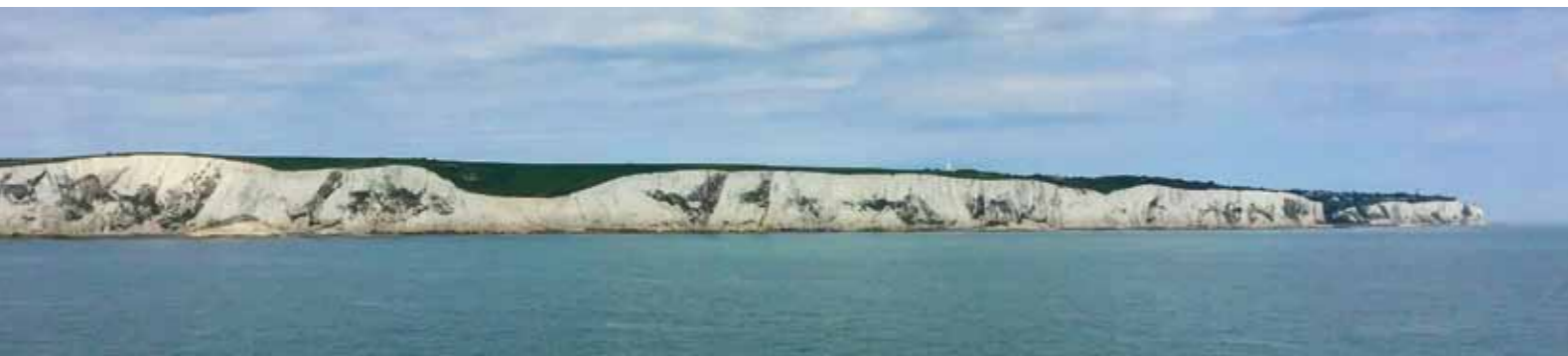
Auf der Überfahrt bekommt man einen tollen Blick auf die 106 Meter hohe Front der bekannten Kreidefelsen von Dover

Die Abfertigung in Calais war logistisch einfach aufgebaut, wir wurden zügig abgefertigt mit grenzüblicher Personenkontrolle plus Kontrolle der Hundeeinreisepapiere, also EU-Pass und notwendige Impfungen gegen Tollwut, Bandwurmbehandlung sowie einen Mikrochip.