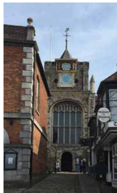
St Mary's Church mit Turmuhr in Rye

Der ruhig und idyllisch gelegene Campingplatz Cherry Hinton liegt außerhalb von Cambridge; auch hier haben wir reserviert, da es nur wenige XXL-Plätze gibt und der Platz aufgrund seiner Nähe zu Cambridge sehr beliebt ist. Die Autofahrt zum Citycenter dauert ca. 15-20 Minuten,