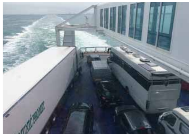
Es regnet! Die Anreise läuft bis auf das Wetter unproblematisch