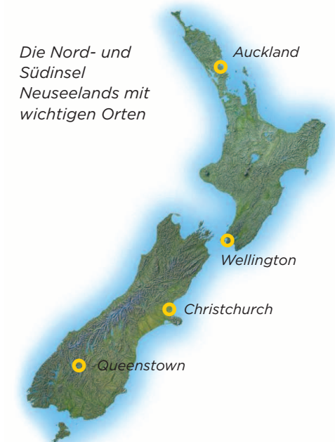
Die Nord- und Südinsel Neuseelands mit wichtigen Orten