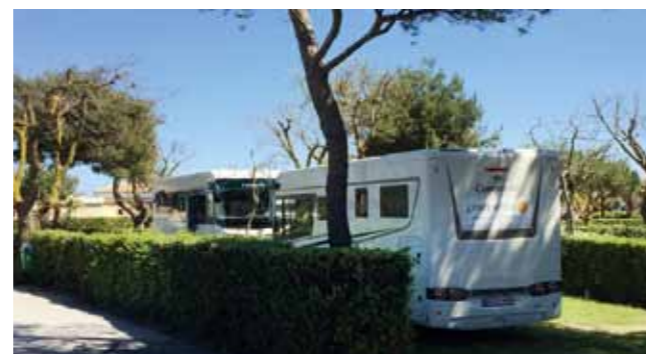
Auch große Mobile bis 9,5 m finden hier einen schönen Platz

Pétanque-Gelände und einen Fitnessraum mit der neuesten Cardiotraining-Ausstattung. Und natürlich werden zahlreiche Wassersportmöglichkeiten mit Partnern angeboten: SUP- und Kajak-Vermietung, Schnuppertauchen, Tauchen im Naturschutzgebiet von Banyuls, Jetski- oder Wasserscooter-Ausflüge sowie Bootsverleih mit oder ohne Skipper und vieles mehr. Einkaufen kann man auf dem südfranzösischen Dorfplatz, mit schattigen Bogengängen und Geschäften, die alles bieten, was man für genussvolle Tage braucht. Eine eigene Bäckerei, einen Obst- und Gemüseladen, einen Weinkeller, einen Supermarkt und ein Kiosk liegen hier beim Restaurant-Bereich, der eine Bar, Eisdielen und Pizzeria bietet. Zu empfehlen ist das Mittagessen auf der Restaurantterrasse im Schatten der lila leuchtenden Glyzinien, denn dann kann man die mediterranen Speisen in Ruhe genießen. Abends isst man zur Unterhaltungsshow auf der kleinen Bühne im Barbereich. Auf den Parzellen steht man, durch Sträucher abgetrennt, wie im eigenen Privatgarten mit dem Duft des Südens in der Nase. Die Komfortplätze sind bis 100 qm groß und verfügen über Strom sowie Frisch- und Abwasser, und gerade in der Vorsaison steht man hier perfekt, auch mit Mobilien bis 9,50 m Länge. (Größere Mobile nur auf Anfrage). Für die vierbeinigen Gäste