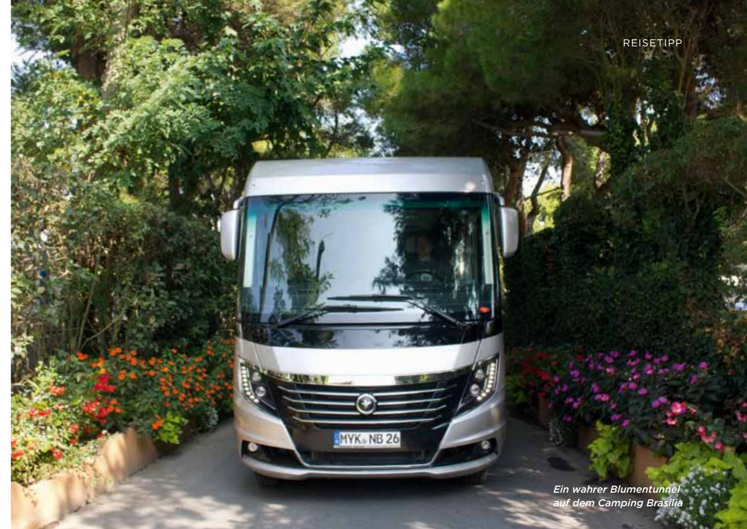
Ein wahrer Blumentunnel auf dem Camping Brasilia