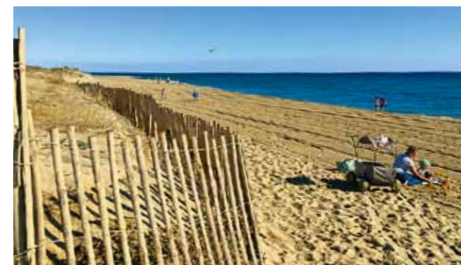
Der schier endlose Sandstrand vor dem Camping Le Brasilia wird jeden morgen gepflegt

Im Ort gibt es sehr gute Restaurants, z.B. das Les Halles ( www.lacreaterie.com ) direkt am Hafen mit sehr leckeren Tagesgerichten, einer schönen Terrasse und einer Rooftop-Bar. Das vom Gault Millau empfohlene, etwas versteckt in einer Wohnstraße gelegene, Restaurant Les Clos des Pins im