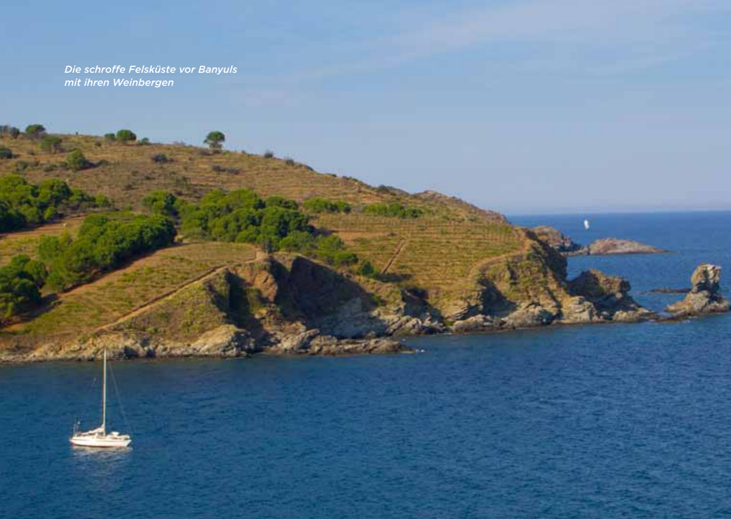
Die schroffe Felsküste vor Banyuls mit ihren Weinbergen