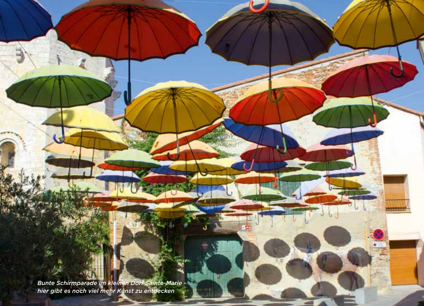
Bunte Schirmparade im kleinen Dorf Sainte-Marie - hier gibt es noch viel mehr Kunst zu entdecken