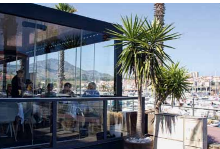
Unten: Das Michelin-Sternerestaurant Le Fanal

am Mittelmeer. Eine Besonderheit ist auch der Unterwasserweg des maritimen Naturreservats von Cerbère-Banyuls, der etwa 5 km entfernt, entlang der Küste Richtung Spaniens, liegt. Banyuls ist die Heimatstadt des bekannten Bildhauers Aristide Maillol. Etwa vier Kilometer vom Zentrum entfernt, befindet sich im ehemaligen Pachthof des Künstlers das Museum Maillol, in dem eine bedeutende Sammlung an Skulpturen des berühmten katalanischen Künstlers zu sehen ist.