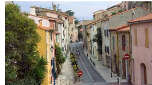
Der Blick in die Gassen von Argelès-sur-Mer

großem Parkplatz für Mobile sowie die »Poissonnerie bar a huitres«, direkt am zentralen Kreisverkehr »Rond-Point de l'Arrivee«. In Argelès Plage gibt es zahlreiche Campingplätze, die alle auf den hier im Sommer stattfindenden Massenansturm ausgelegt sind. Der einfache Camping La Chapelle liegt zentral an der Tourismusinformation und bietet einige Plätze für große Mobile. Weiterhin hat Argelès einen schönen Yachthafen mit vielen Bistros und Bars.