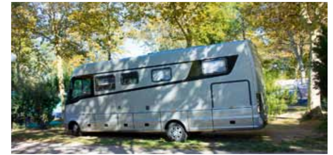
Der Camping La Chapelle hat einige XL-Plätze

Zwischen Meer und Alberenmassiv (1.157 m), wo die Pyrenäen ins Meer tauchen, liegt Argelès-sur-Mer. Das alte Dorf ist authentisch mit katalanischem Flair, engen Gassen und der Kirche Notre-Dame-des-Prats mit zinnbewehrtem 34 m hohem Turm (14. Jh.). Hier gibt es einen traditionellen Wochenmarkt, Kunsthandwerk und viele Feste. Den Strandort Argelès Plage säumt ein 7 km langer Sandstrand und auf der von Bäumen bestandenen Strandpromenade lässt es sich gut flanieren. Aber hier sieht man gleich, dass der Badeort vom Tourismus lebt, daher sollte man sich von den vielen Restaurants mit Event-Gastronomie-Charakter nicht zuviel erwarten. Ausnahmen sind hier das Restaurant im Spielcasino Comptoir JOA mit schöner Meeresterrasse - auch mit