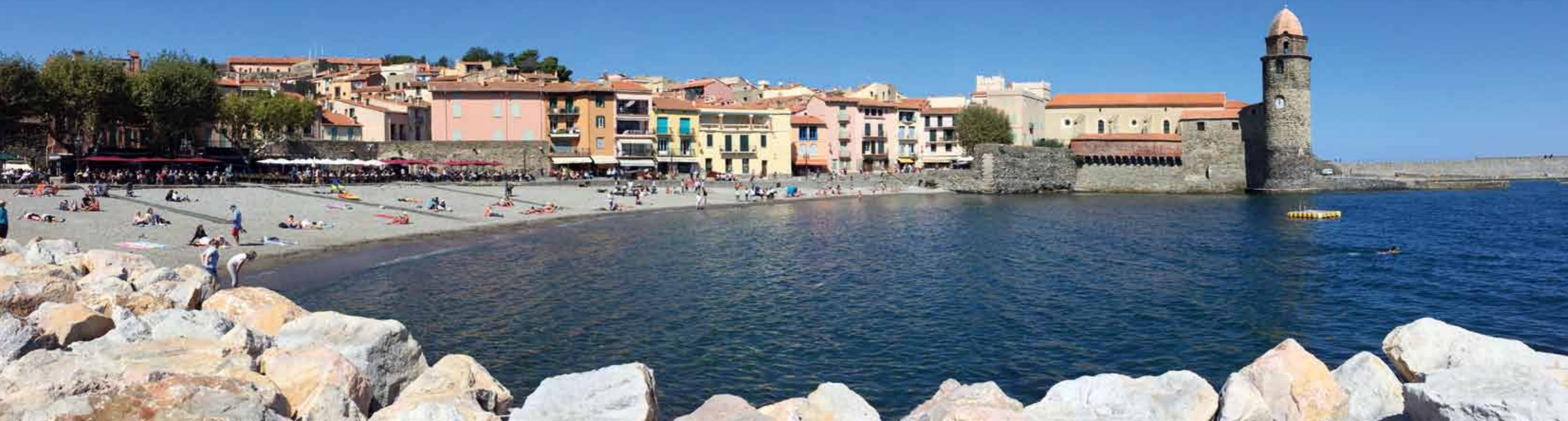
Blick auf die Strandpromenade und die Kirche Notre Dame des Anges in Collioure